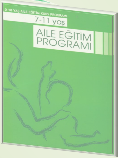
7-11 Yaş AEKP Eğitici kitabı