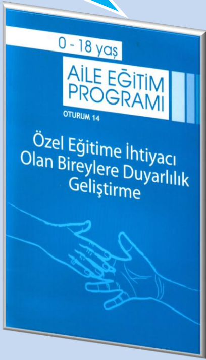
0-18 Yaş AEKP 14.Oturum Eğitici Kitabı