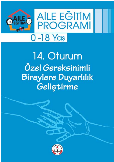
14. Oturum Kitapçığı