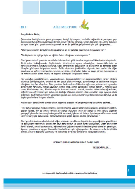
14. Oturum Anne- Baba Eki